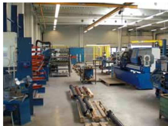
Das Uni-Cardan Service Center Nürnberg ist ISO 9001:2008 zertifiziert.