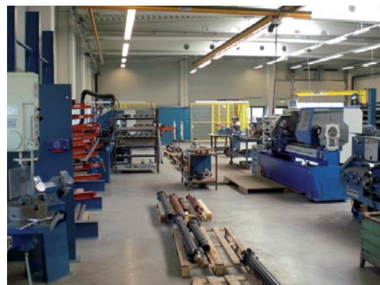
Das Uni-Cardan Service Center Stuttgart ist ISO 9001:2000 zertifiziert.